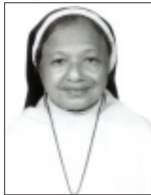
സി. ഡിഗ S.H.