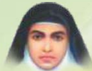
The Diocese of Bhadravathi