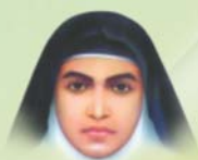
The Diocese of Bhadravathi